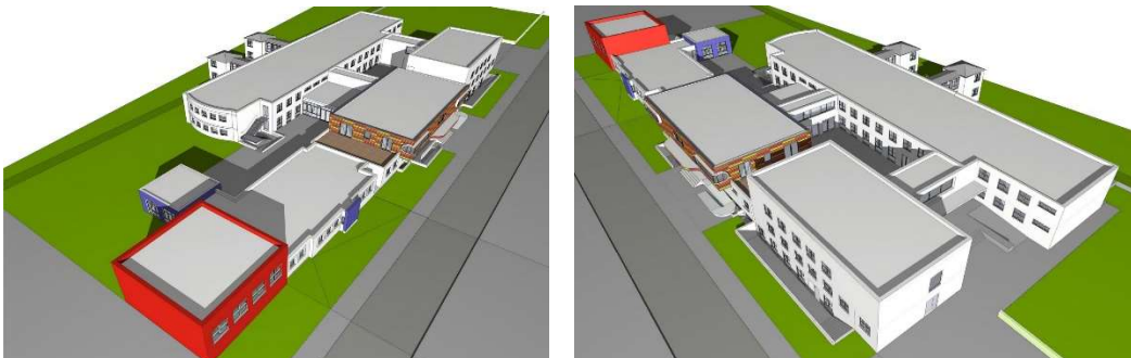
Erweiterungsbau - Gesamtanlage / Entwürfe Wittig&Brösdorf

Für den Fachunterricht stehen die vorhandenen Fachräume für Musik, Werken und Kunst der bestehenden Schule mit dem Förderschwerpunkt geistige Entwicklung zur Verfügung. Ebenfalls ist vorgesehen, dass Bibliothek, Speiseraum, Aula und Turnhalle durch die Schüler*innen beider Schularten genutzt werden. So werden zahlreiche Begegnungsmöglichkeiten im gesamten Schulgebäude für Schüler*innen mit und ohne Behinderung geschaffen. Für die Mitarbeiter*innen und Mitarbeiter gibt es Material-, Arbeits-, Pausen- und Beratungsräume.