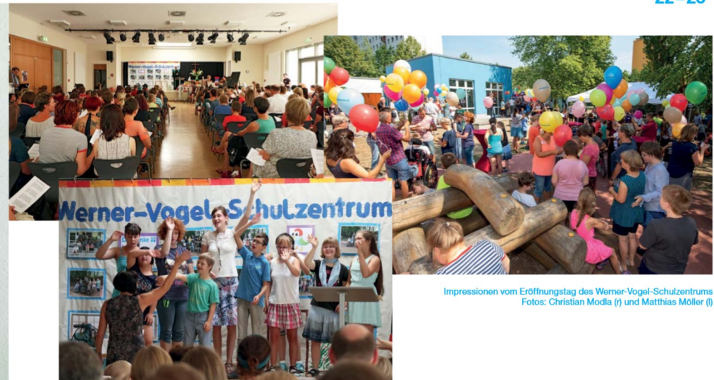
Impressionen vom Eröffnungstag des Werner-Vogel-Schulzentrums

Um 12 Uhr wurden auf dem Außengelände des Werner-Vogel-Schulzentrums 100 Luftballons steigen gelassen – ein buntes Bild vor malerisch blauem Himmel. Danach gab es Essen und Musik mit der Straßenmusikband „The Coins“.