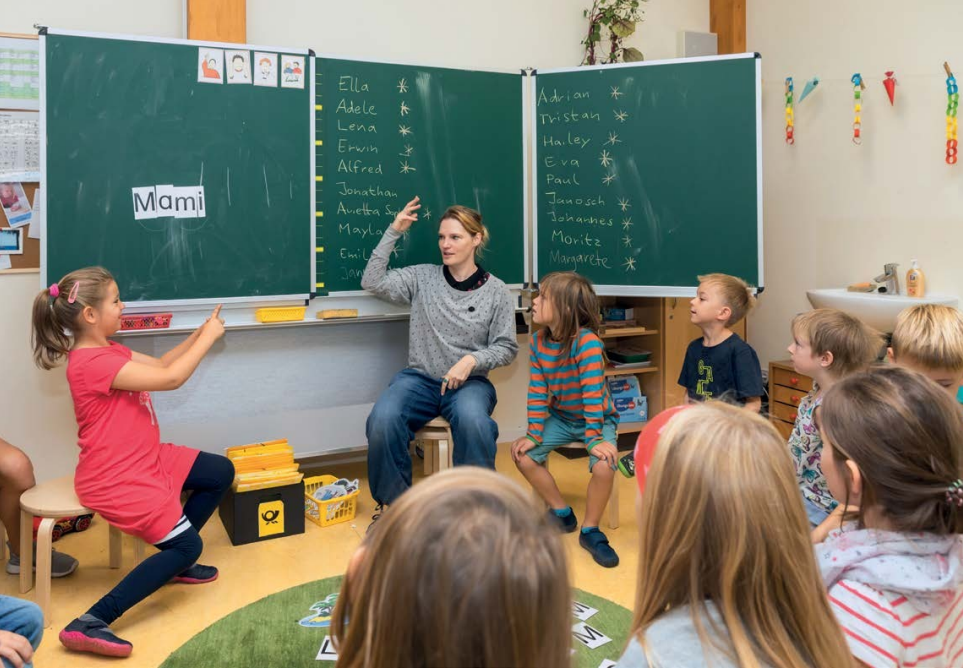
Die Kinder der ersten integrativen Grundschulklasse des Werner-Vogel-Schulzentrums

das richtige, es waren die richtigen Personen an Bord und Geld war da.