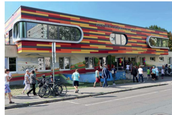
Die erste Klasse des neuen Grundschulteils hat ihren Klassenraum bis zur Errichtung des zusätzlichen Gebäudeteils im alten Haupthaus der Schule.

Die Werner-Vogel-Schule hat seit 2009 auf Projektbasis die Idee der Integration verfolgt, angestoßen durch die Ratifizierung der UN-Behindertenrechtskonvention. Im Herbst 2014 war dann die Schulentwicklung an einem Punkt, an dem wir bereit waren, alles etwas fundamentaler anzugehen. Und mit diesem Punkt meine ich: Das Schulklima war