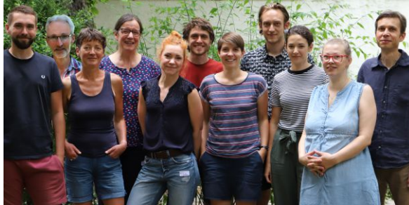
Unser Team ist für Sie da!